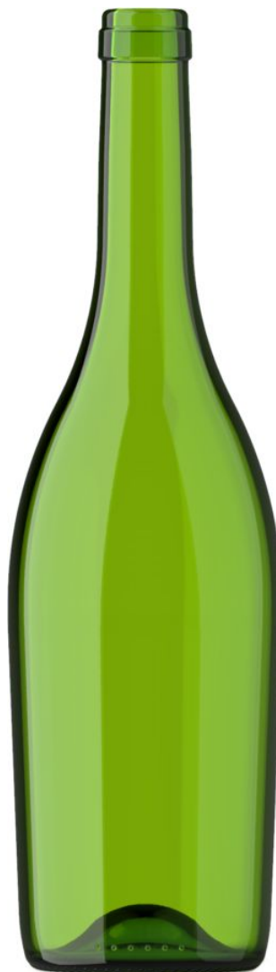
VERDE PARA CHAMPÁN