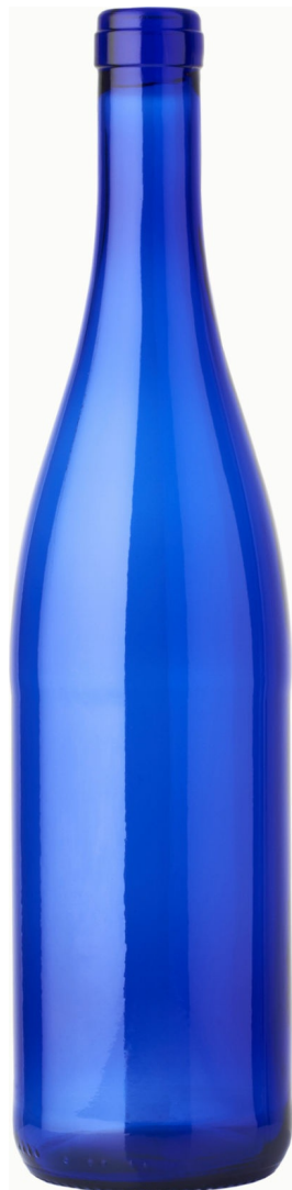
AZUL REAL DE LUJO